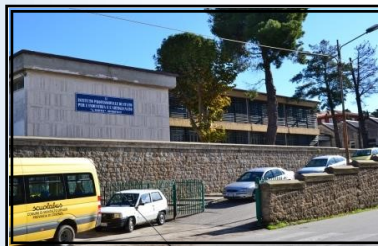
SEDE DI MONTALTO UFFUGO