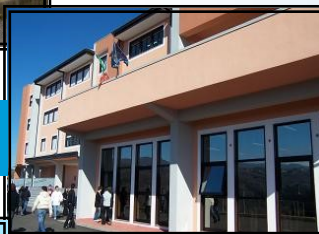
SEDE DI ROGLIANO