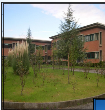
SEDE DI COSENZA